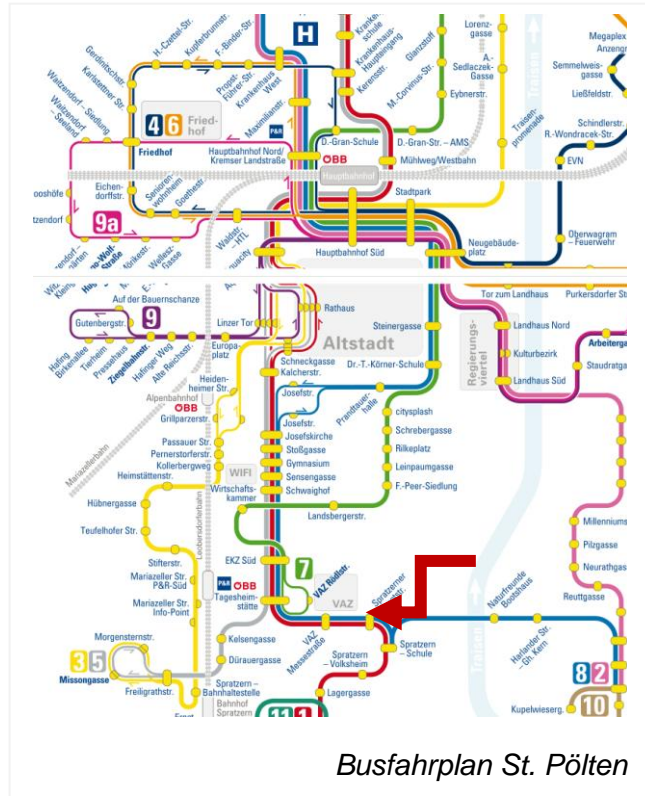
Busfahrplan St. Pölten