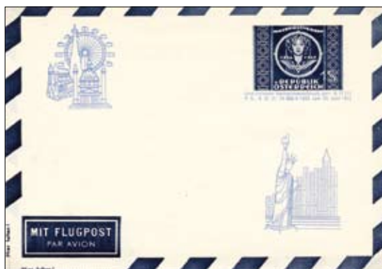
→ Abb 2: Markeneindruck der 1 Schilling-UPU-Marke auf Flugpostumschlag. Ausgabedatum Juli 1950, Auflage 1.000 Stück. Bereits mit Genehmigungsvermerk vom 29. Juni 1950.