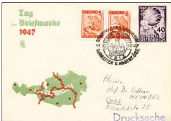
→ Abb 13: Seltene Privatganzsache ohne Zudruck,

→ Abb 12: Privatganzsache, nach der ersten Währungsreform als Inlands-Drucksache gelaufen. Die Telegraphenmarke war bereits ungültig, daher Zusatzfrankatur von 10 Groschen-Marken der Landschaftsprovisorien. Sonderstempel Weiz vom 14.12.1947.