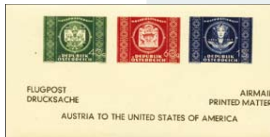
↑ Abb 1a: Der UPU-Adresszettel, der zum Missbrauch führte. Ausgegeben im Juni 1950, Auflage 13.000 Stück.

Ein als Markenblock gestalteter Adresszettel der UPU-Serie führte 1950 zu einem Missbrauch ( Abb. 1a und 1b ). Er wurde im Ausland, hauptsächlich in den USA, als „amtlicher UPU-Block“ teuer verkauft. Die Post reagierte mit Einschränkungen des § 17. Noch im Juni 1950 musste unter der Marke der Vermerk „Unmittelbarer Wertzeicheneindruck gem. § 17 (1) PO. gen. mit BMZI. ... vom ...“ eingedruckt werden ( Abb. 2 ).