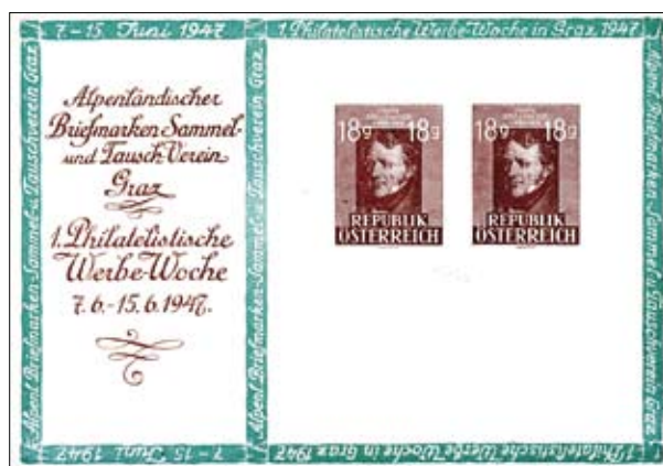
→ Abb. 7: Privatganzsache „Erste philatelistische Werbewoche“. Orts-R-Brief, Sonderstempel Graz 1 vom 7.6.1947.