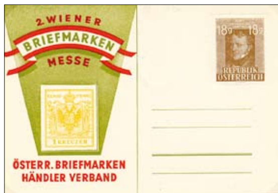
← Abb 9: Privatganzsache „2. Wiener Briefmarkenmesse“, ungebraucht.

→ Abb 10: Privatganzsache, bildseitig Portrait von Dr. Karl Renner. Auslandskarte mit portogerechter Zusatzfrankatur, OT-Stempel Gmunden vom 22.8.1947. Internationale Doppelsensur: US-Zensuren aus Linz und München.