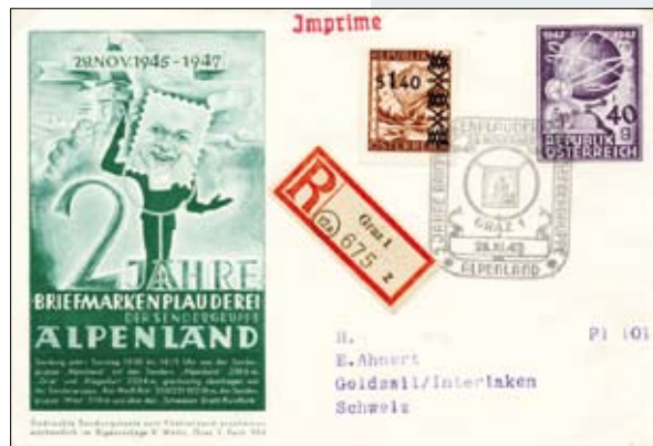
→ Abb 11: Privatganzsache auf portogerechter Auslands-R-Drucksache. Sonderstempel Graz 1 vom 28.11.1947.

→ Abb 12: Privatganzsache, nach der ersten Währungsreform als Inlands-Drucksache gelaufen. Die Telegraphenmarke war bereits ungültig, daher Zusatzfrankatur von 10 Groschen-Marken der Landschaftsprovisorien. Sonderstempel Weiz vom 14.12.1947.