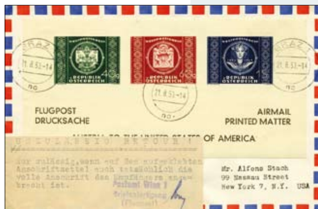
↑ Abb. 1b: Derselbe UPU-Adresszettel auf Luftpostbrief in die USA, nicht widmungsgemäß verwendet. Die Adresse befindet sich auf dem Umschlag und nicht auf dem Adresszettel. Daher wurde der Brief von der Post – mit einem entsprechenden Aufkleber versehen – zurückgesandt. OT-Stempel Graz 1 vom 21.8.1950.