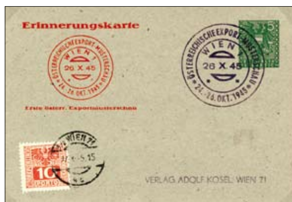
↑ Abb. 5: Privatganzsache, als „Erinnerungskarte an die Exportmusterschau 1945“ ausgegeben. Sonderstempel Wien 1 vom 26.10.1945.