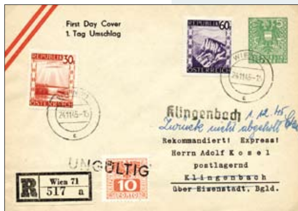
↑ Abb. 4: Privatganzsache, verwendet zur Gestaltung dieses Ersttagsbriefes (Ersttag der 30- und 40 Groschen-Marken der Landschaftsserie). OT-Stempel Wien 71 vom 24.11.1945.

3) Karte, Ausgabedatum Oktober 1945, Auflagenhöhe unbekannt. Sie wurde als „Erinnerungskarte an die Exportmusterschau 1945“ und an die Feier „500 Jahre Stadt Gmünd“ verwendet (Abb. 5 und 6). Die Wappenausgabe wurde wie alle anderen Marken mit der Währungsreform 1945 ungültig. Nicht so die Postkarten, die weiterhin gültig blieben.