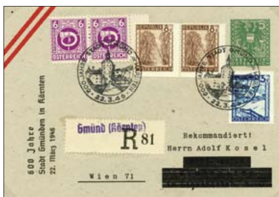
↑ Abb. 6: Privatganzsache „500 Jahre Stadt Gmünd“ (in Kärnten). Sonderstempel Gmünd vom 22.3.1946.