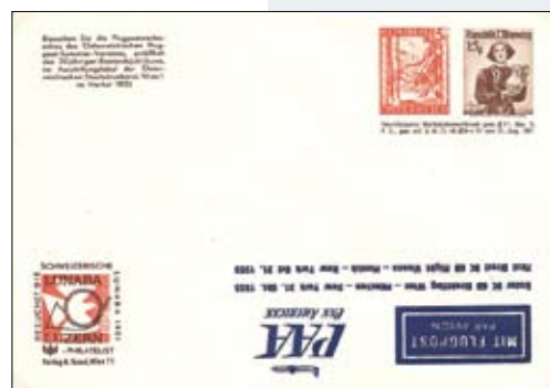
1.2.4. Zudruck kopfstehend